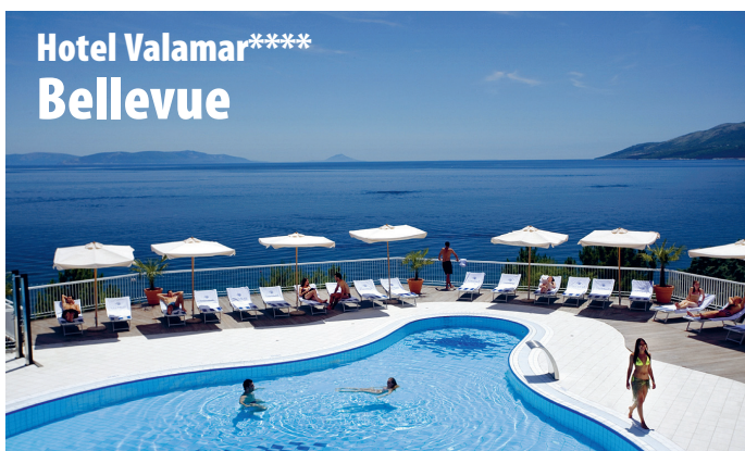
Hotel Valamar**** Bellevue

16. - 20. MAI 2012 (Feiertagstermin) • ISTR IEN • RABAČ